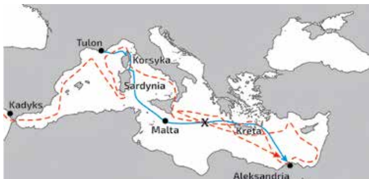
Ryc. 1. Trasy przebyte przez flotę inwazyjną Napoleona i ścigającego ją Nelsona. „X” – miejsce minięcia we mgle 22 czerwca.

uszkodzenie masztu flagowego „Vanguarda”, zawróciły do Gibraltaru, zakładając, że reszta eskadry także tam zawróci. I tyle te fregaty widziano. Nelson proaktywnie naprawił swój okręt na Sardynii i został za to pokarany – stracił oczy i uszy swojej eskadry.